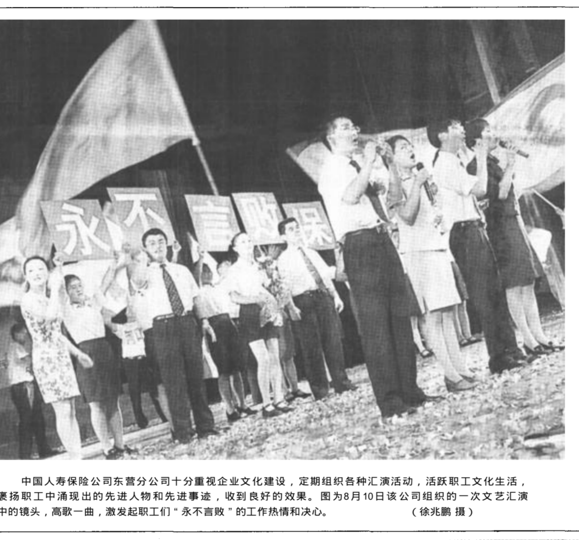
中国人寿保险东营分公司十分重视企业文化建设，定期组织各种汇演活动，活跃职工文化生活，褒扬职工中涌现出的先进人物和先进事迹，收到良好的效果。图为8月10日该公司组织的一次文艺汇演中的镜头，高歌一曲，激发起职工们“永不言败”的工作热情和决心。

迅速行动 紧密配合 加强管理 我市召开全市广播电视安全播出会议 本报讯 8月13日下午，我市召开全市广播电视安全播出会议，号召全市有关部门紧急行动起来，加强行业管理，加强对广播电视信号的保护及对重点部位的监控，及时查处非法销售的接收系统和设施，保证全市广播电视安全、优质播出。副市长陈胜出席会议并讲话。 陈胜在讲话中要求，此次活动由政府负责，各有关部门协作执行。市政府成立有广电、公安、安全、工商、教育、信息产业等市直有关部门、石油大学、济军生产基地和东营区政府参加的联合检查组，各检查组要统一部署，迅速行动，紧密配合，彻底拆除违规和非法安装的境外卫星接收设施，依法从源头上治理非法销售卫星接收卡和卫星电视地面接收设施。专项治理的重点区域是中心城区和各县区政府驻地及商业密集区；明确行动的政策依据及各部门职责。政策依据是国务院颁发的有关广播电视安全保护的法律法规。各级有关部门要按照“属地管理”的原则，积极配合，明确各自职责，确保任务的完成；要切实加强对加强卫星地面接收设施管理重要意义的认识。近年来，卫星电视越境覆盖的情况越来越普遍，加强境外卫星接收管理工作越来越重要，各级有关部门要从保障改革和建设顺利进行的高度，提高认识，采取果断有效的措施，坚决打击各类违法行为和破坏广播电视安全播出的行为，保证全市广播电视安全、优质播出，为全市经济的发展和和社会的稳定做贡献。 （记者 彭华）