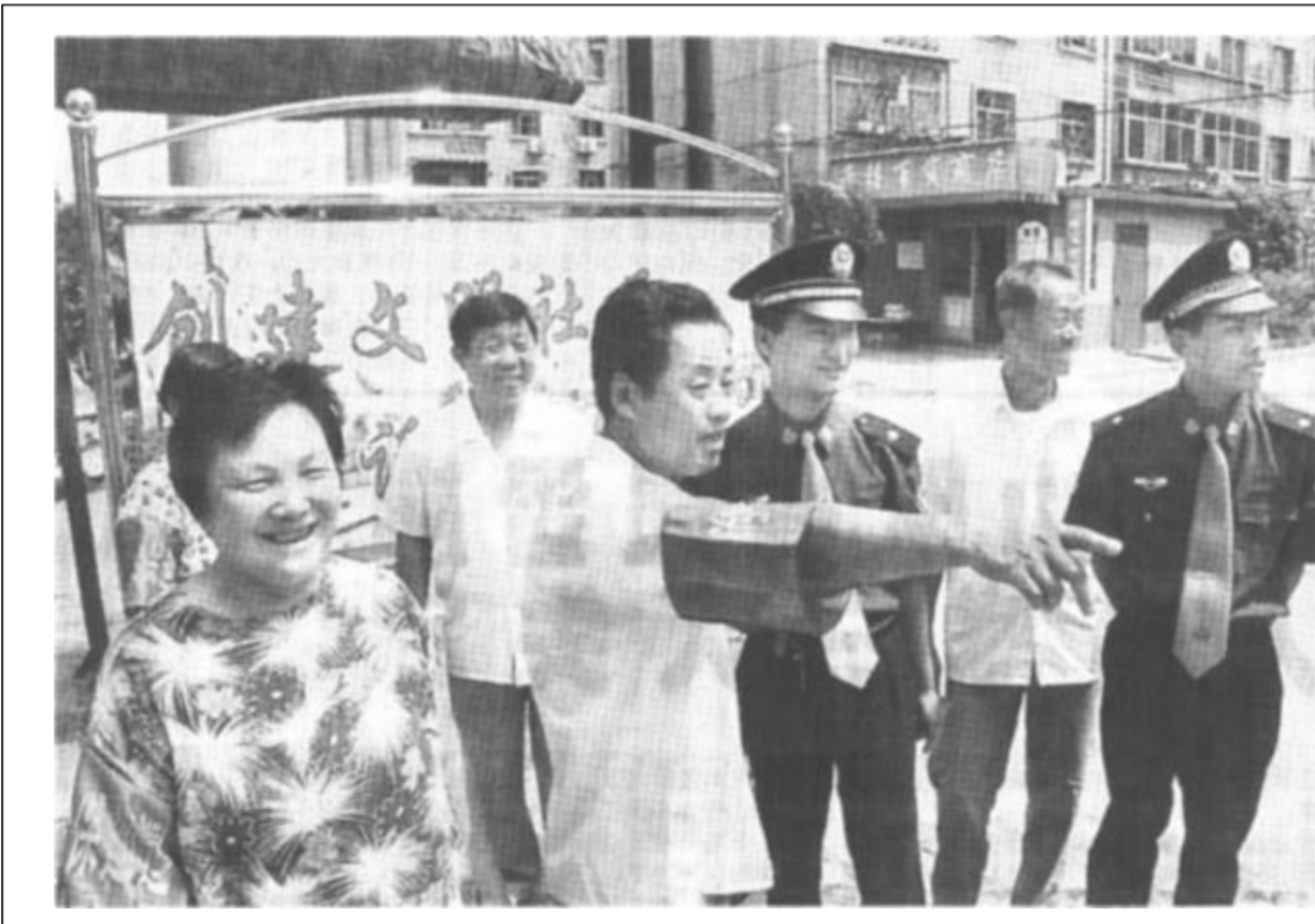
东营区文汇办政通社区充分发挥社区离、退休老干部的作用,加强社区治安力量...